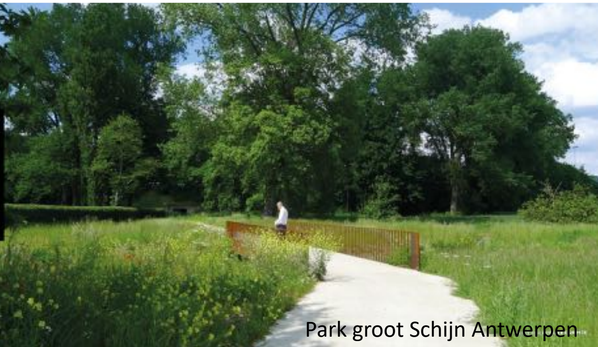
Park groot Schijn Antwerpen