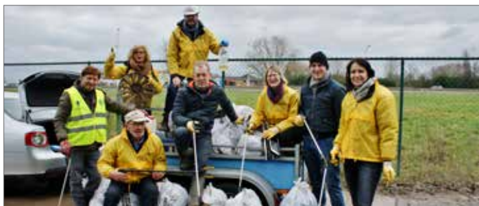
▲ N-VA steekt de handen uit de mouwen voor een propere gemeente.