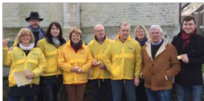
▲ N-VA heeft een hart voor Meise-Wolvertem. Ook dit jaar voerden we een valentijnsactie op de markt in Meise.