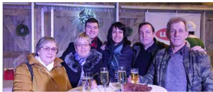
▲ N-VA goed vertegenwoordigd op de gezellige winterhappening van de lokale middenstand.