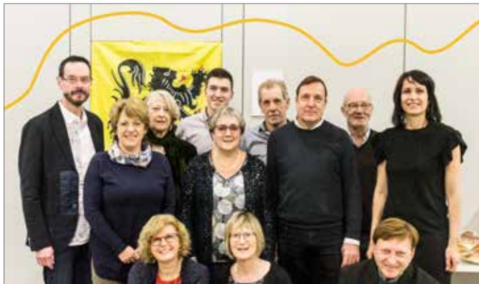
▲ Uw N-VA-bestuur werkt aan een veilige thuis in een welvarend Meise-Wolvertem!