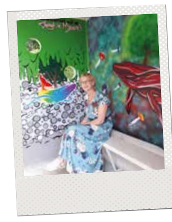
▲ Op verschillende locaties fleurt graffitikunst onze gemeente op. Hiermee wil het bestuur vandalisme tegengaan in samenwerking met de jeugd.